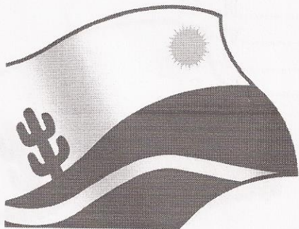
GUSTAVO MACIEL LINS DE ALBUQUERQUE Prefeito

Gabinete do Prefeito, 31 de Março de 2015.